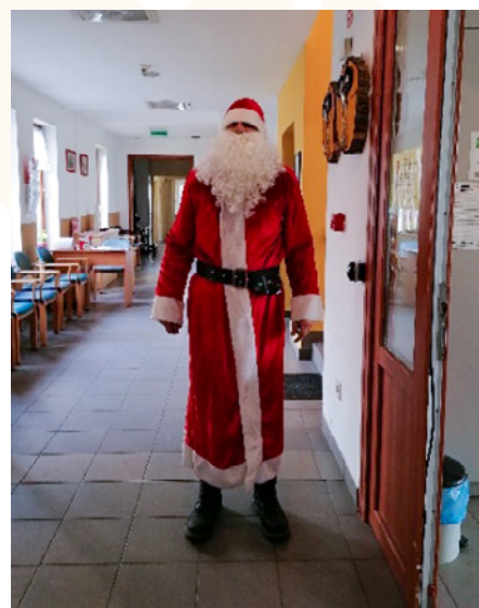
Megérkezett a Mikulás