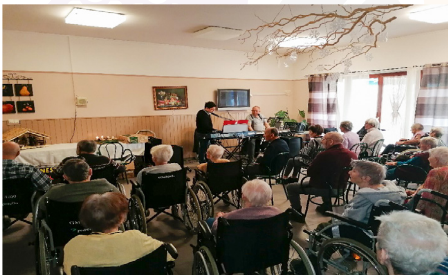
Advent 2. vasárnapján

A kívülálló szemében szomorúnak tűnik a családtagoktól távol megélni az ünnepeket. Ez valóban nehéz időszak ellátottjaink számára, ezt kívánja oldani a december elején megkezdődő ünnepi készülődés. A kórus próbákkal kezdetét veszi a karácsonyra hangolódás. Szinte körbe lengi az épületet a karácsonyi dalok hangulata. A karácsonyi kórusban éneklő idősök a heti rendszerességgel meg-