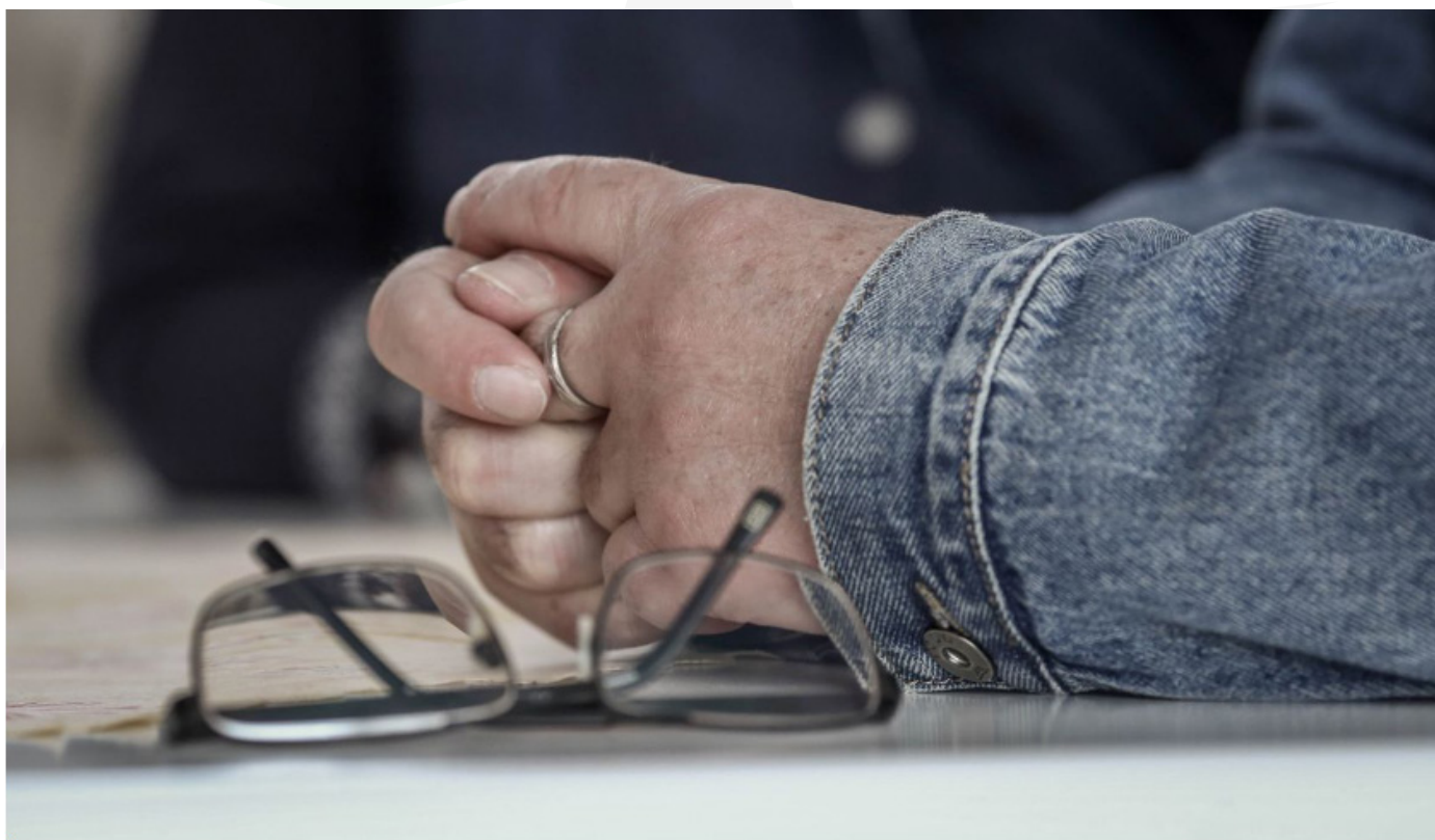
Mondjunk nemet! - üzeni Gábor.